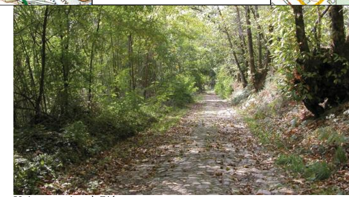
Voie romaine à Piégut