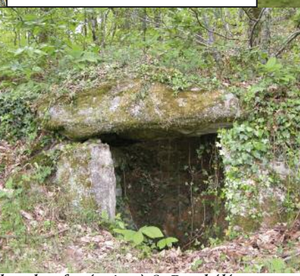
Chambre funéraire à St Barthélémy