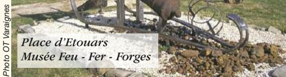
Place d'Etouars Musée Feu - Fer - Forges