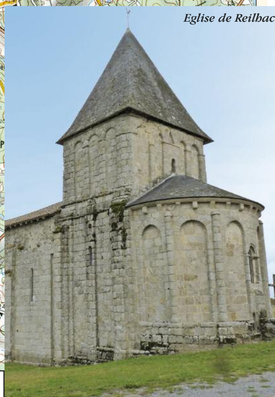
Eglise de Reilbac

PIEGUT La Tour de Piégut (boucle 11) Vestige d'un important édifice militaire qui daterait du XIIe siècle. Cependant les machicolis n'ont remplacé les tours en bois que vers le milieu ou la fin du XIIIe siècle. Ce qui confirmerait que Richard Cœur de Lion ou ses troupes, lors de leur passage en Nontronnais, auraient fait démolir au cours de leur siège la partie haute de la Tour qui par la suite aurait été reconstruite en y ajoutant le nouveau système de machicolis en pierre. Donjon bien conservé aux proportions remarquables dominant la campagne vallonnée et verdoyante. Accès libre. Renseignements : OT Piégut 05 53 60 74 75