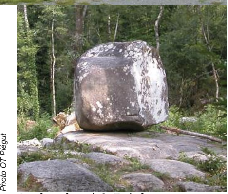
Roc branlant à St Estèphe